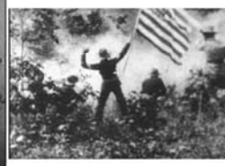
14.Advance of ...