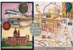
26.No es lo mis...