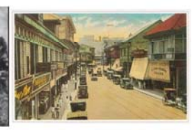
15.The Escolta, ...