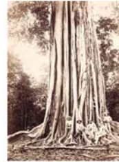
04.Tronco de ba...