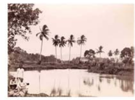
05.Estero de Ma...