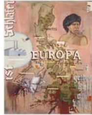
02.Land Where ...