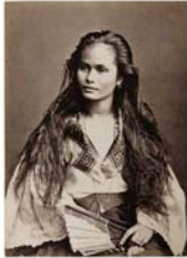
06.Indígena de ...