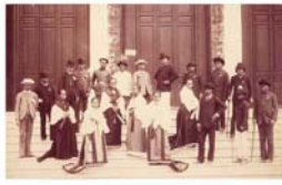
07.Grupo de filip...