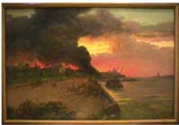
16.The Burning ...