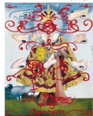
27.Santo Ninyo ...