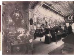
08.Sala del pala...