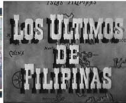
13.Los últimos d...