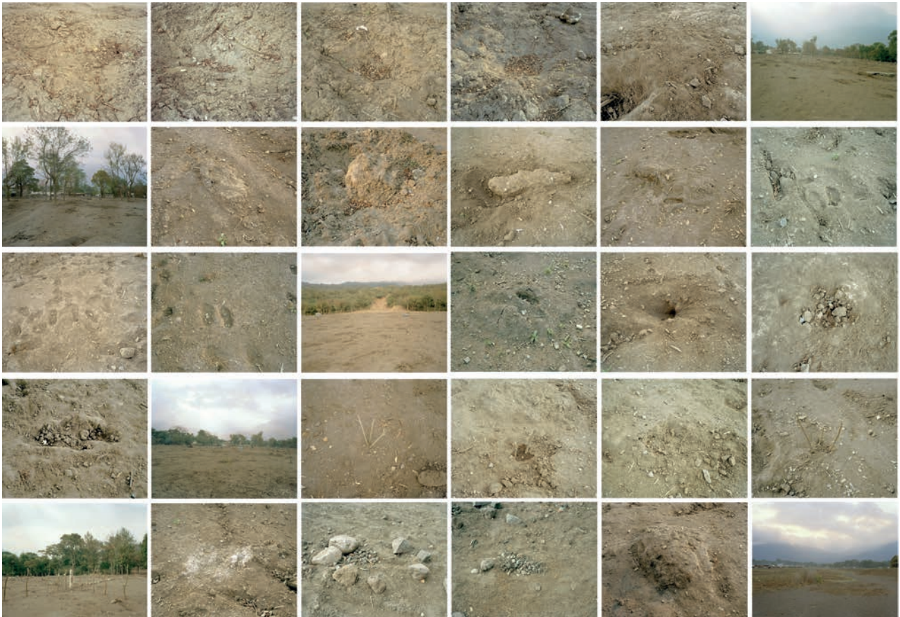
Xavier Ribas: Estructuras invisibles 2 (Barro) , 2006. CGAC Collection.

new paradigms of the twenty-first century architecture and urbanism, a sign that the capitalist modern project has not worked out that well.