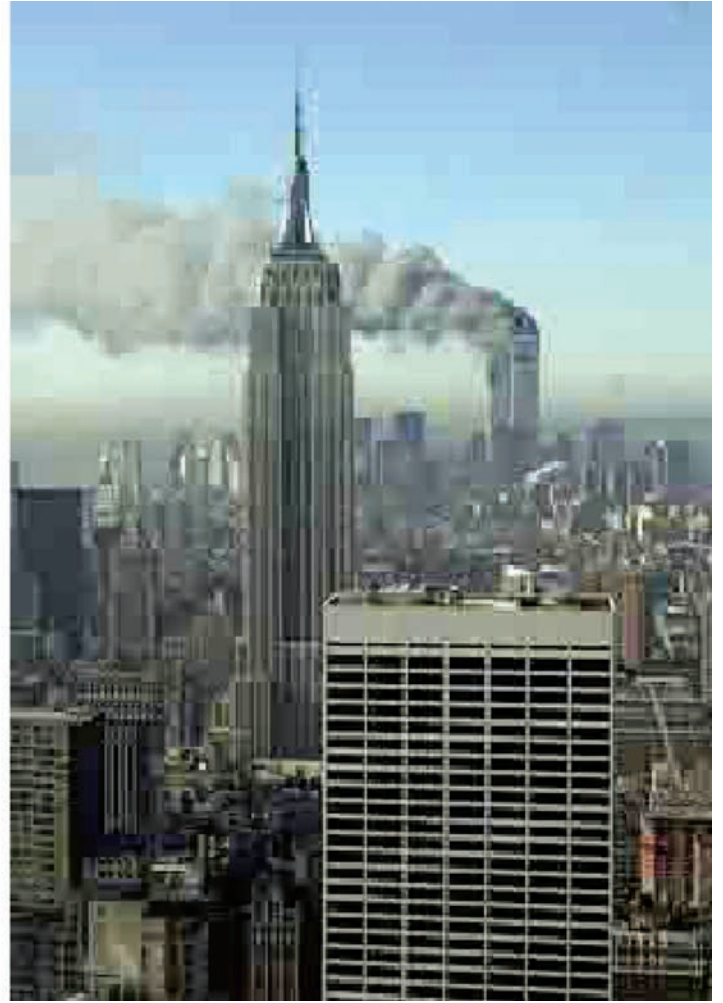
Thomas Ruff: Jpeg NY 08 / Jpeg NY 09 , 2006. Colección particular. Depósito na Fundación RAC. © Thomas Ruff, VEGAP, Santiago de Compostela, 2016

perspectiva ideolóxica e política (Berlín, Gorizia/Gorica, Nicosia, etc.), así como unha pequena biblioteca de acceso directo en salas que permitirá consultar unha bibliografía imprescindible para comprender os retos políticos do noso presente.