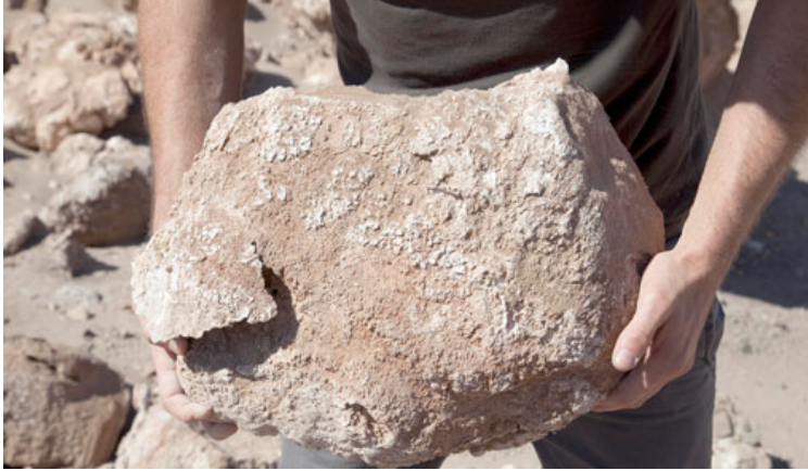
Caliche Fields, 2010

Esta es la primera exposición de Xavier Ribas en el MACBA y es una de las pocas que el museo ha dedicado a un artista que proviene estrictamente del mundo de la fotografía. La muestra se concentra en dos aspectos en la producción de los últimos diez años del fotógrafo. Por un lado, una serie de trabajos reunidos bajo epígrafes como “Domingos” o “Geografías concretas”, como los citados sobre los lugares en los que se ejerce la prostitución, en los que se ha fijado en lugares periféricos de la ciudad. Son sus series de fotografías más célebres, básicamente porque en una ciudad como Barcelona que tanto se mira al ombligo y a la que tanto le ha gustado repensarse ofrecen otra mirada de la ciudad.