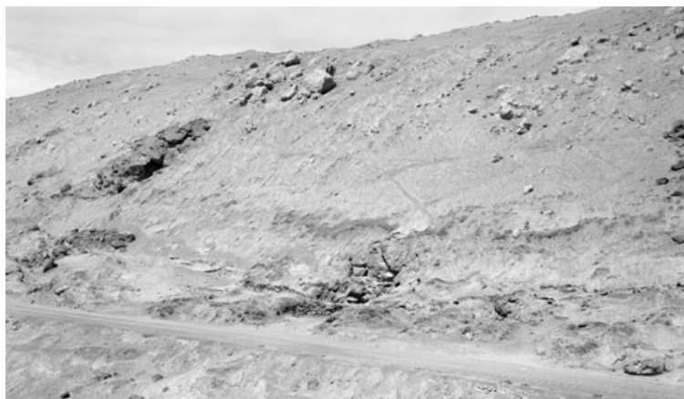
Xavier Ribas.: Desert Trails , 2012

DAVID G. TORRES | 05/09/2014 | Edición impresa