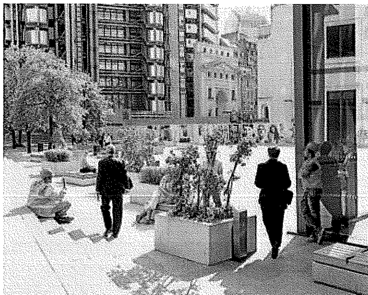
Detalle de 'from the high-rises like rain', 2013

Nos encontramos frente a una red de sucesos cronológicamente discontinuos que encadenan secuencias aleatorias, con casos relativos a la geografía, la historia, la economía, la política o los derechos humanos. Cuando vayan a ver la muestra, tómense su tiempo y déjense llevar. |